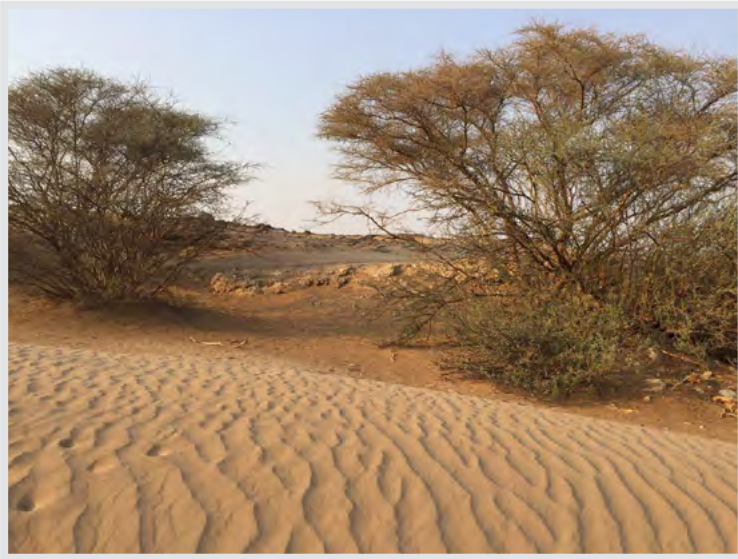
شجرات السمرفي الوادي حول غدير خم، وقد خطب النبي صلى الله عليه وآله وسلم تحت شجرتي سمرف