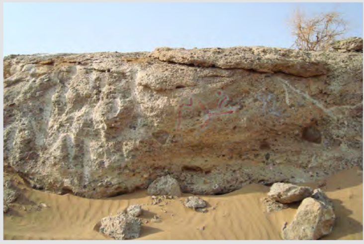
صورة قديمة لمكان الغدير بعد أن دفنه السيل