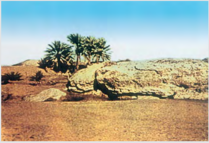
صورة قديمة لغدير خم