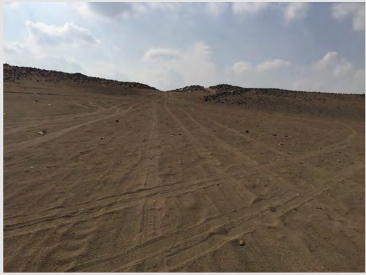
طريق القوافل القديم بين مكة والمدينة، ويسمى: طريق الأنبياء ويقع غدير خم شرق هذا الطريق