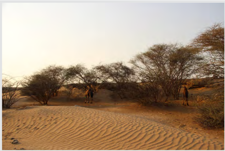
دوحات السمر حول غدير خم