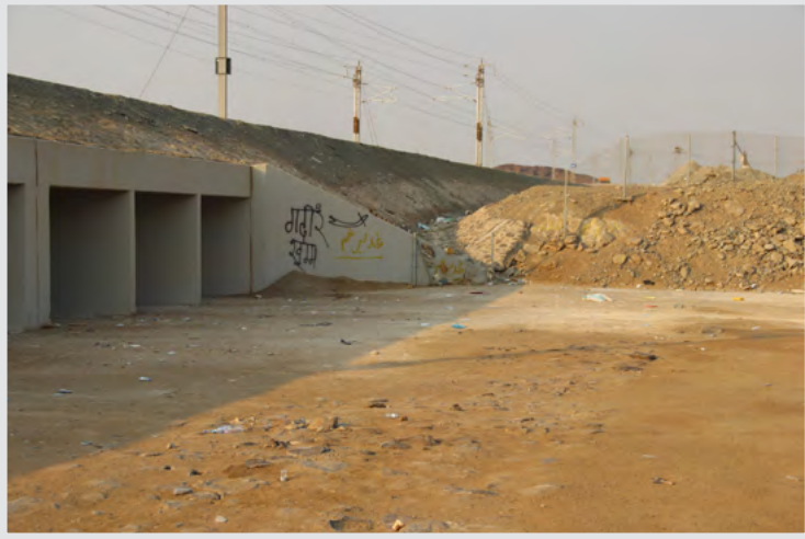
مكان الغدير على حافة جسر قطار الحرمين