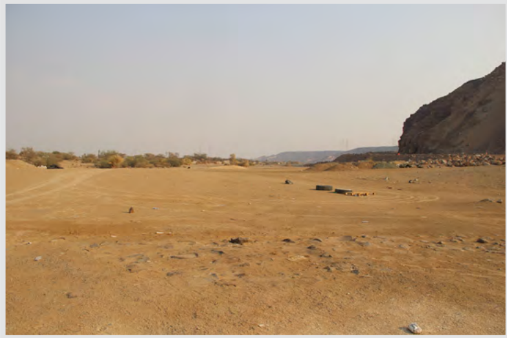
وادي الجحفة الذي يقع على شفيره غدير خم