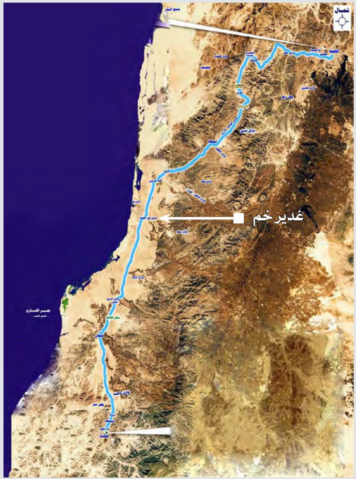
موقع غدير خم على طريق حجة الوداع