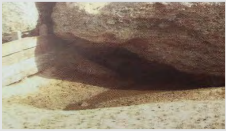
صورة قديمة لحوض الغدير