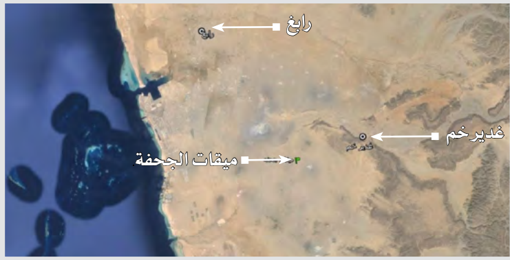
صورة جوية يظهر فيها غدير خم والجحفة