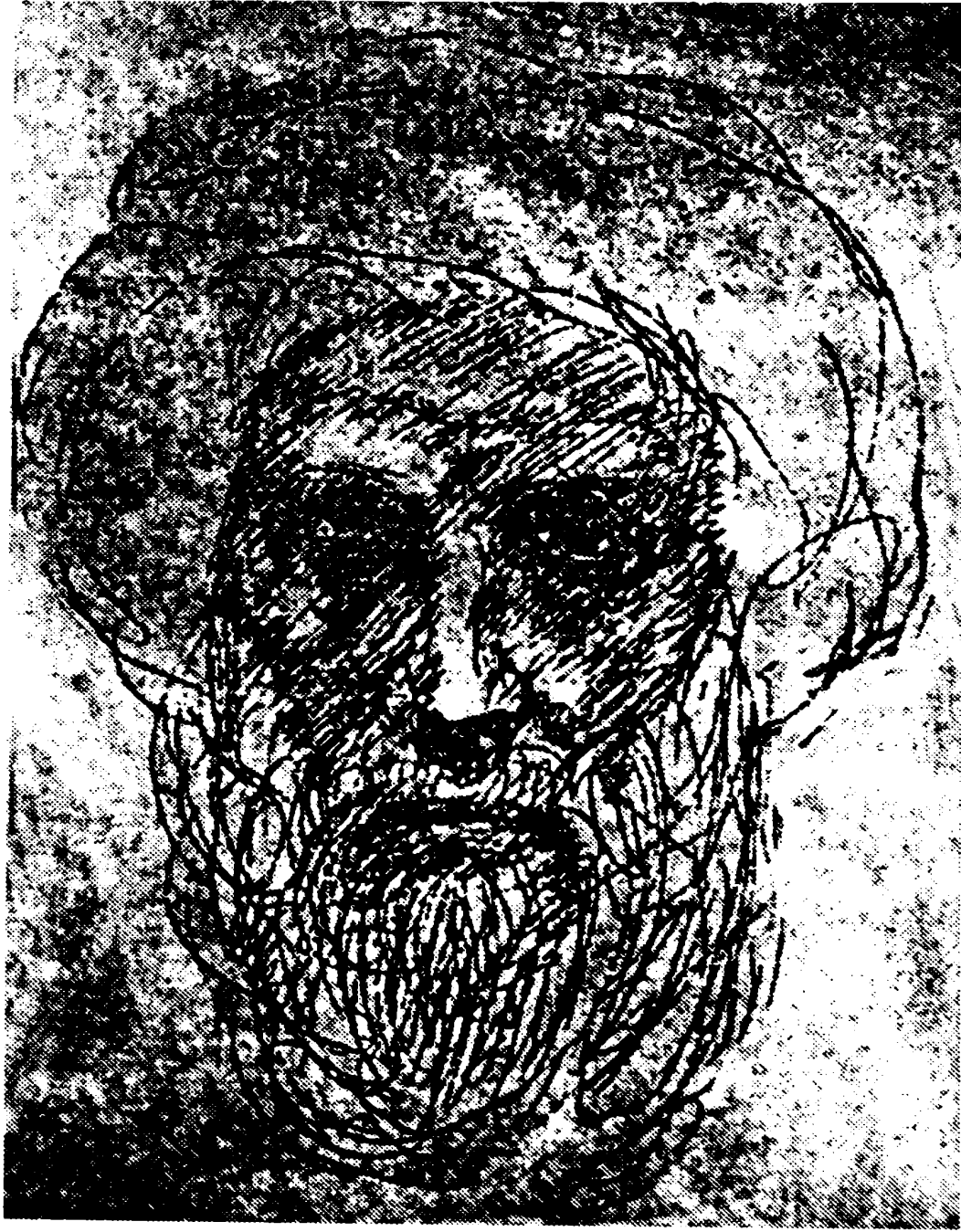
صورة متخيلة لأمير المؤمنين علي (ع) بريشة جبران خليل جبران