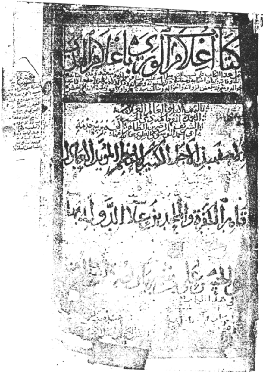
نموذج الغلاف للمخطوطة «ط»