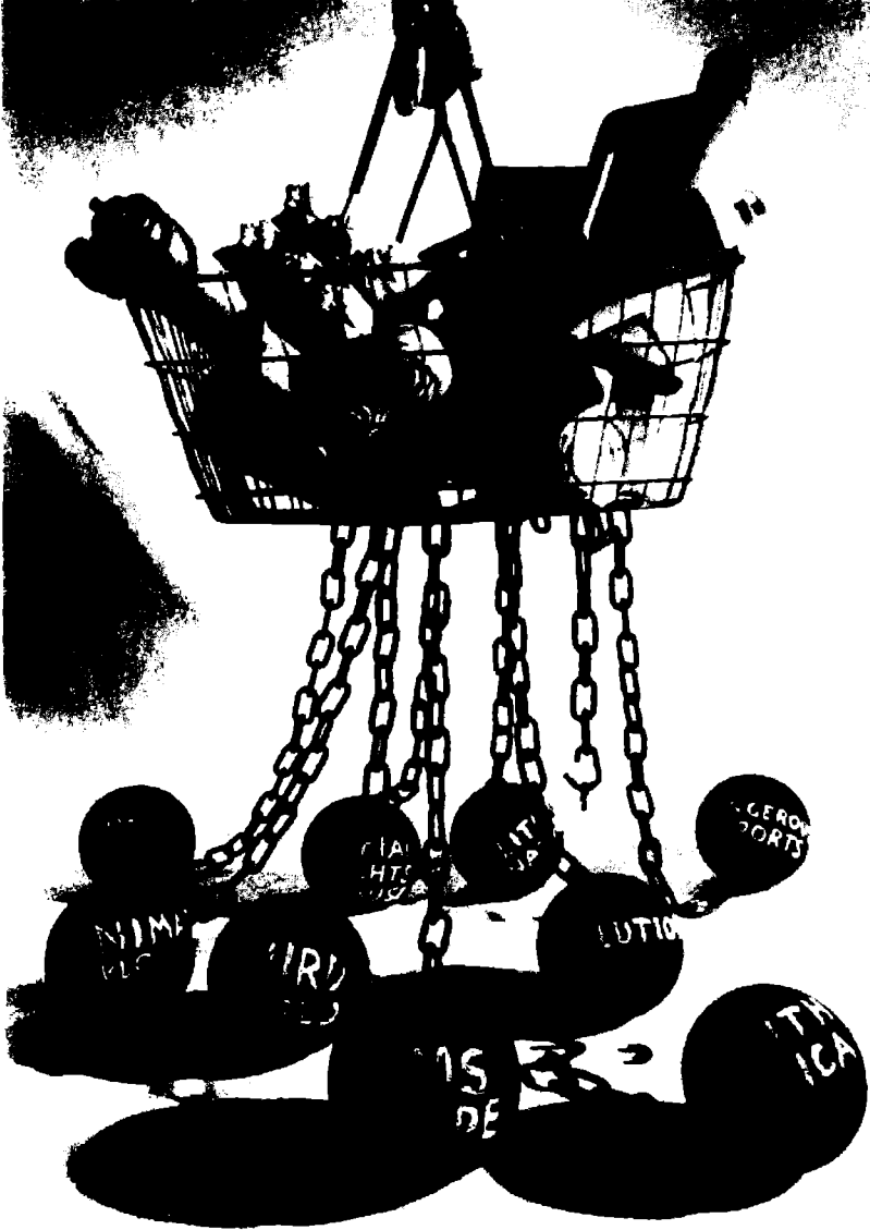
الصورة ٢٠٨: إعلان لأجل مجلة «المستهلك الأخلاقي»، ١٩٩٤ حقوق النشر من مجلة «المستهلك الأخلاقي» وبوليب Polyp.