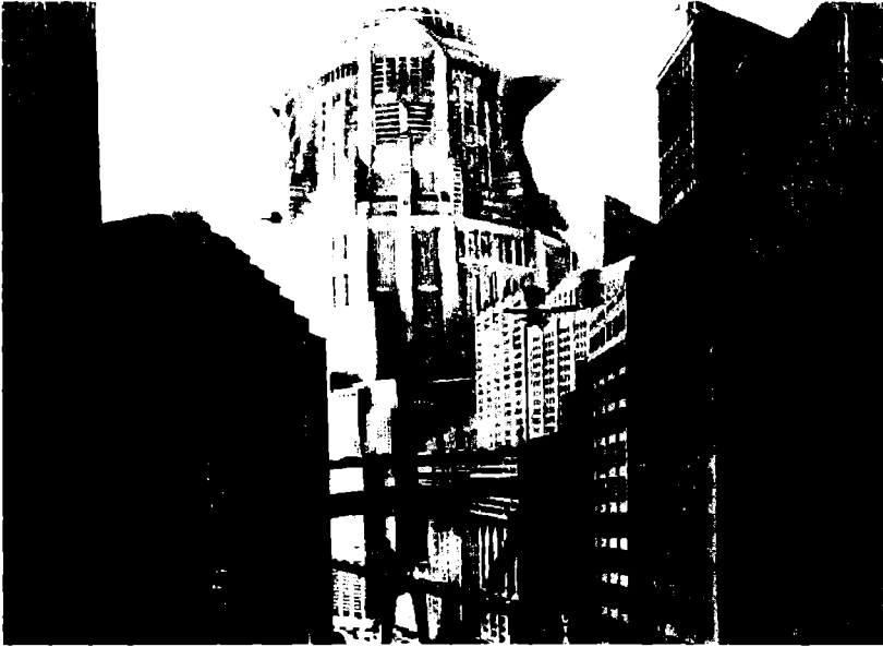
الصورة ٦ - ١: صورة ساكنة من فيلم «العاصمة الكبرى» لفريتز لانغ، ١٩٢٦

وتحت حكاية العاصمة المنتصرة هذه يوجد الجهد المطلوب لتثبيت المدينة الصناعية الحديثة. وفي الأفضية الجهنمية. في العالم المدفون. تحت المدينة، يصور لانغ التجريد الوحشي لصفات العمال الإنسانية. وهنا تحيا الحياة بحسب الزمن الميكانيكي للبوبق والصفارة. ويترك العمال منازلهم ويدلفون في الصف إلى أماكن عملهم مثل بشر أوتوماتيكيين. وتظهر الشخصية الرئيسية في صراع يهلك النفس لضبط آلة ما، يتصارع مع العتلات للسيطرة عليها حتى أنه يحس بإنهاك تام. فالعمل خاضع تماما للآلات التي يخدمها الناس عوض العكس. وفي أماكن عملهم تحت سطح الأرض يخدم الناس المدينة عوض العكس. والآلة التي يجب على البطل أن يتصارع معها هي نفسها لها شكل ساعة كبيرة - إذن يتصارع البطل لأجل السيطرة على سرعة حياة مضبوطة بالآلات، وبما هو ميكانيكي بدلا من الزمن الإنساني.