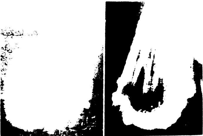
خلية دم تتأثر بآيات القرآن ويتغير المجال الكهروطيسي حولها، وعند ذبذبات محددة تنشط هذه الخلية