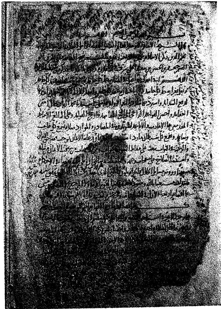
٢. صورة الورقة الأولى «ب» من نسخة شرائع الإسلام «الف»