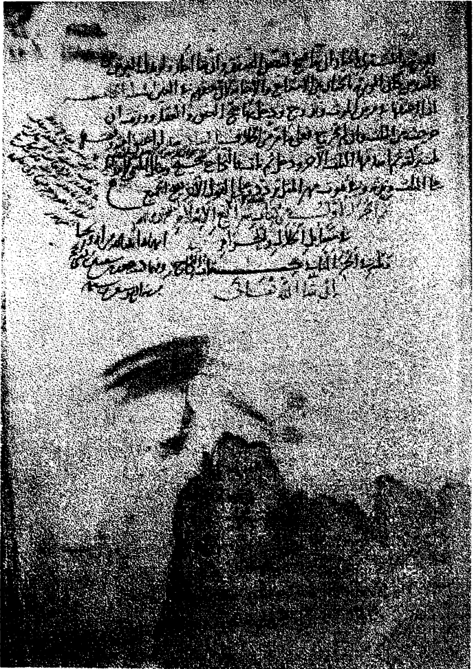
٣. صورة الصفحة الأخيرة من الجزء الأول من نسخة شرائع الإسلام «الف»