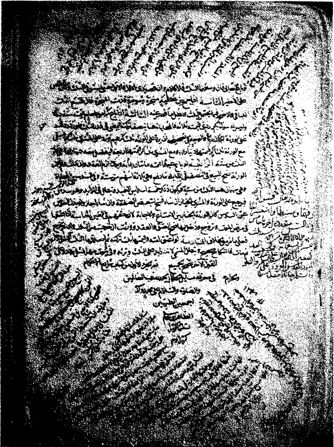
٥. صورة الصفحة الأخيرة من الجزء الأول من نسخة شرائع الإسلام «ع»