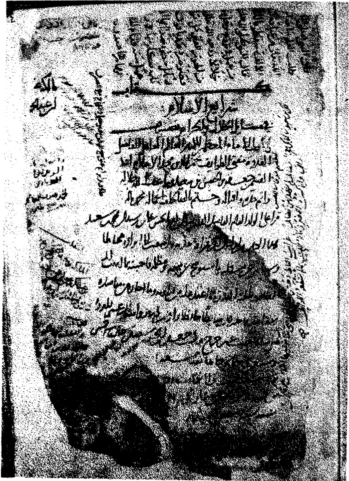
١. صورة الورقة الأولى «أ» من نسخة شرايع الإسلام «الف»