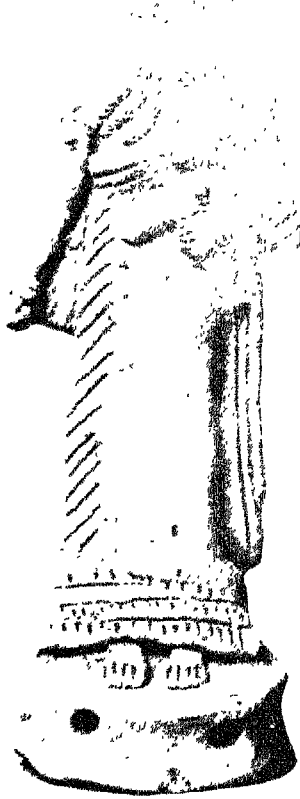
دمية من الفخار لعامل الآلهة النليل ( منصف الألف الثالث ق م )

روم الابداع في المكتبة الوطنية ببغداد ١٦٣ سنة