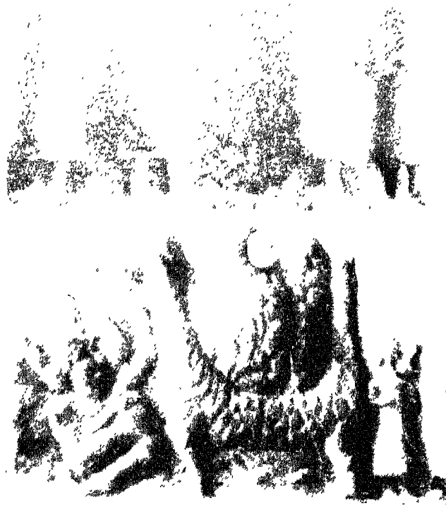
منحوتة من الرخام تحمل مشهد اسطوري له علاقة بإله الخصب « نيموز » ( نهاية الالف الثالث ق.م )